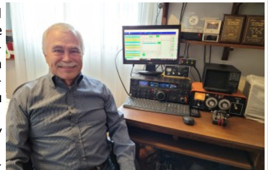
Leo CX3AL, 1st place SB 20 LP

En 80m en todas las categorías HP - LP y QRP dominaron las estaciones europeas, con victorias de S53R, LY3BRA y EN3OQ respectivamente.