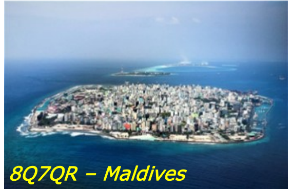
8Q7QR – Maldives