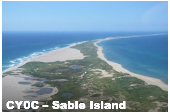
CY0C – Sable Island