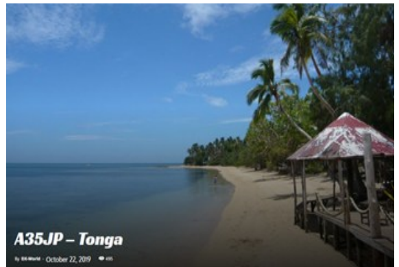
A35JP – Tonga