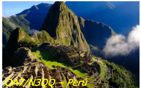
OA7/N3QQ – Perú

Yuri N3QQ , estará activo como OA7/N3QQ desde Machu Picchu, Perú entre el 6 al 12 de agosto de 2020, QRV en HF.